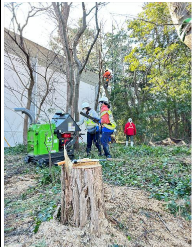
青陵大の皆さんが粉碎作業中